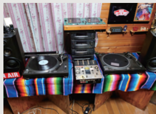
プライベートでは大の音楽好き。