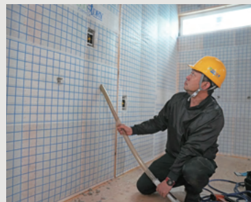
隙間なく吹き込むには高度な技術が必要。