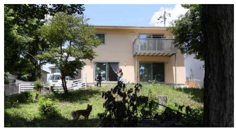
▶裏側の広々としたお庭。この「わが家専用感」はここにしかないものです。