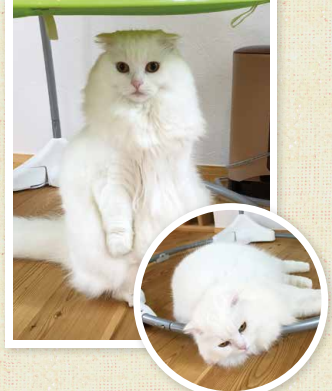
▶立ち姿が美しい、I様邸のこもちゃん。カメラがいなくなるとハイ、お疲れ様でした！