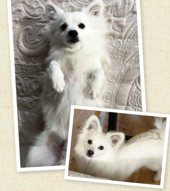
▶M様邸のライム君は犬の甘ん坊。毎日こんな顔で見られたら、心までとろけちゃいますね。