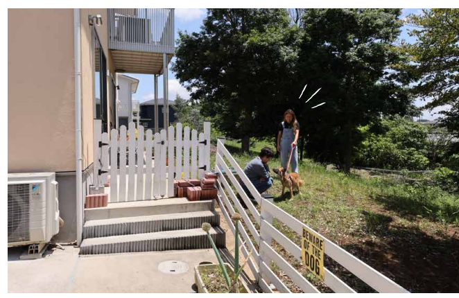
▶ドッグランだけでなくいろいろな使い方で楽しめるお庭です。