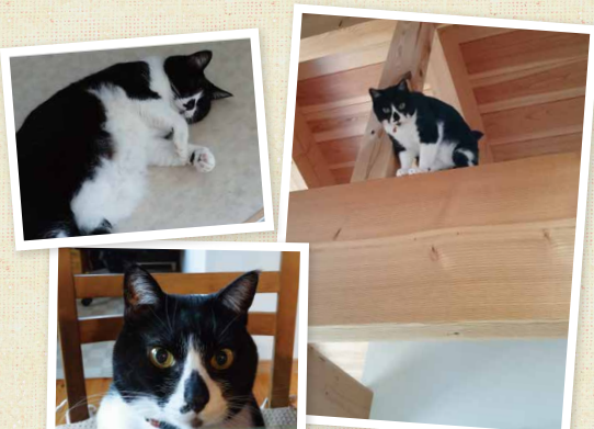
▶E様邸のうめちゃんも木に登って遊ぶのが大好き。キリッとしたドヤ顔と、お休み中のゆるい感じのギャップがたまらない。