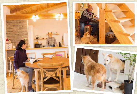
▶ワンちゃんと暮らすT様。もうお互いに、何をしても自然体です。玄関には専用の出入口をつけて、楽に入出入りできるようにしてあります。

ナルシマの家で暮らすワンちゃん、ネコちゃんをちょっとだけご紹介。癒されてください！