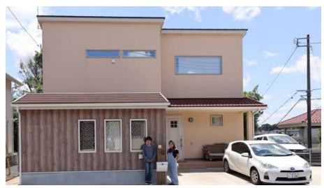
▶色にもこだわり南国風の外観デザインにしたS様邸。道路側から庭は見えない。

道路側からは庭が見えないので、気兼ねありません。思い描いていた暮らしが実現できて、本当に幸せです！