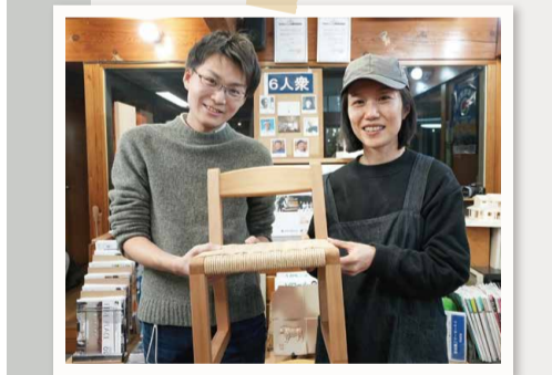
大敬副社長の第二子誕生をお祝いして、早速編集スタッフからプレゼント。