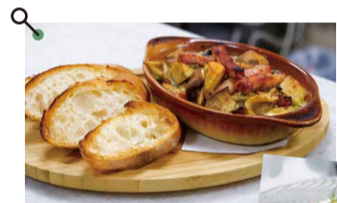
520度の超高温で一気に焼き上げたアヒージョ