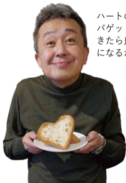
ハートのバゲットがきたら良い一日になるかも！

私のおすすめは、ポルチーニ茸の芳醇な香りが病みつきになる「ポルチーニ茸とキノコの黒毛和牛のミートソースフェットチーネ」。写真の目玉焼きのトッピング、実は私だけのスペシャルバージョンなんです。お客様の様子や好みに合わせて、その時の最高の食材で提供されるお料理には、どれも唸るばかり。Wineも話もどんどん