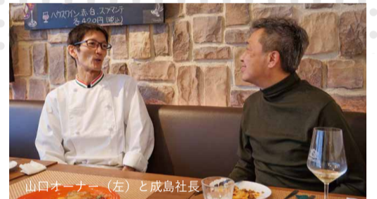
山口オーナー (左) と成島社長