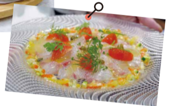
見た目も美しい愛媛県産シマアジのカルパッチョ