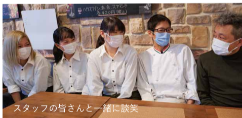
スタッフの皆さんと一緒に談笑

進み、『カステッロ』がピエモンテを巡るグルメツアーを計画してくれたら、ぜひ行きたいな〜と盛り上がりちゃいました。何でもマニュアル一辺倒じゃないのが心憎いお店を訪れ、大満足のナル散歩でした。