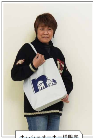
ナルシマオーナー様限定