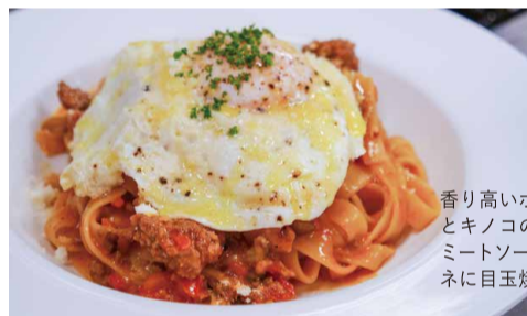
香り高いポルチーニ茸とキノコの黒毛和牛のミートソースフェットチーネに目玉焼きをプラス

進み、『カステッロ』がピエモンテを巡るグルメツアーを計画してくれたら、ぜひ行きたいな〜と盛り上がりちゃいました。何でもマニュアル一辺倒じゃないのが心憎いお店を訪れ、大満足のナル散歩でした。