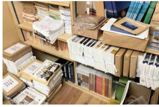
積み重ねた資料の数々。これはまだ序の口です(笑)。

奥行きが無駄に深い収納の奥底には、何十年も開かれていない山積みの雑誌。「後で使うかも」と残しておいて、結果使われなかった備品の数々。「収納は作るだけモノが増えますから、程々にしておきましょうね〜」とお客様にはよく話しておりますが、それが骨身にしみます。