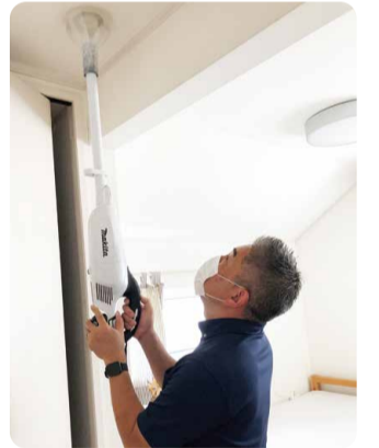
左2枚/排気口はトイレやクローゼットの天井に取り付けられており汚れた空気や湿気を排出しています。右/排気口のホコリを掃除機で吸い取ります。

右のQRコードからお申し込みいただくか、「ナルシマ家守り相談ダイヤル」にお電話ください。