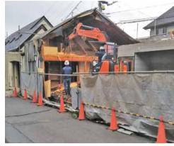
解体が始まった本社事務所。

事務所のリフォームに向けて、喧々諤々、ああでもないこうでもないで打合せを繰り返している中、着々と事務所解体工事が進んでいます。そんなナルシマが直面しなければならない大仕事、それは二度の「引越し」です。