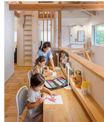
お子様はとても仲が良く、勉強も遊びもいつも一緒。奥様はどこにいても、みんなの気配を感じています。