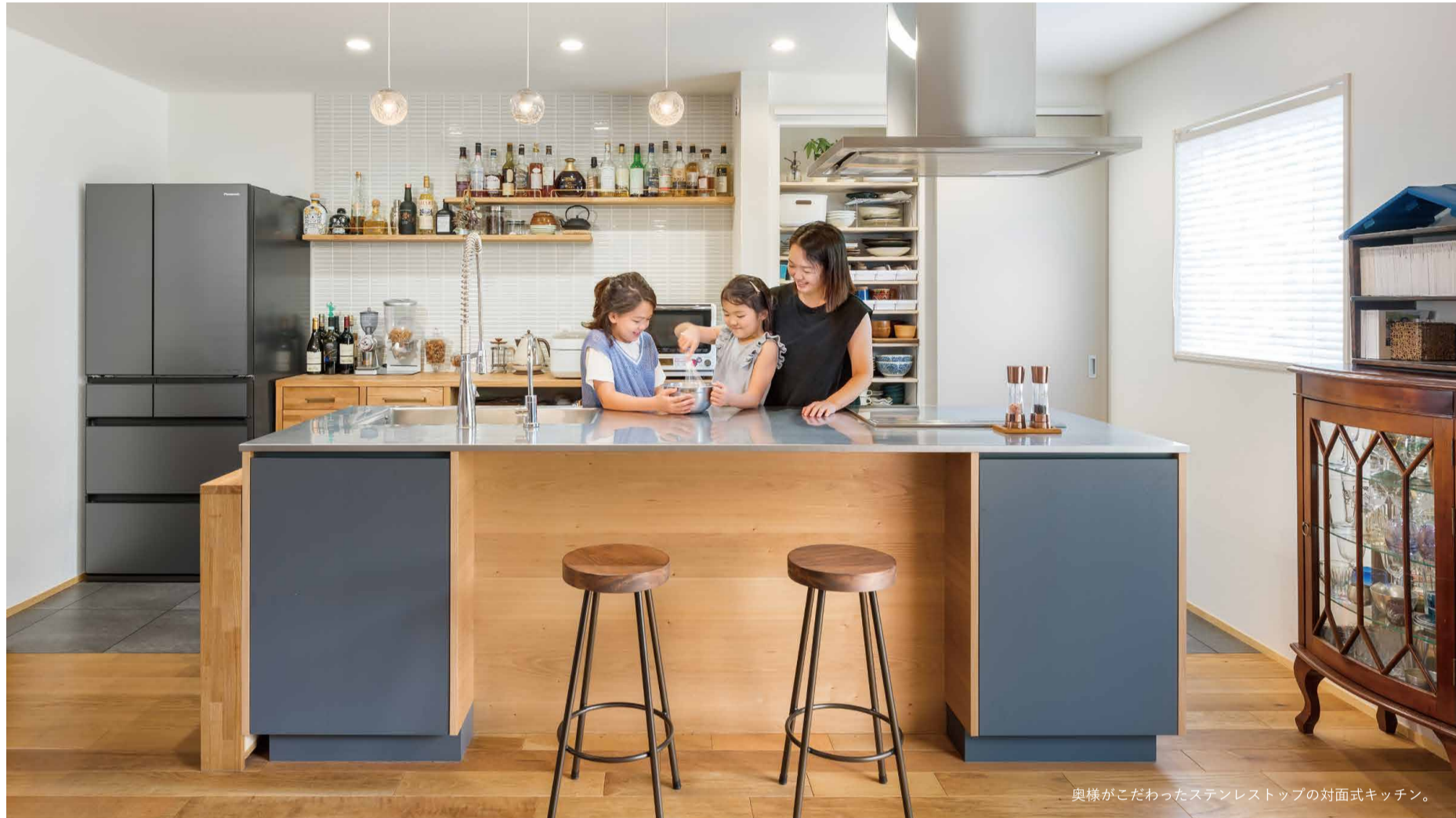
奥様がこだわったステンレストップの対面式キッチン。