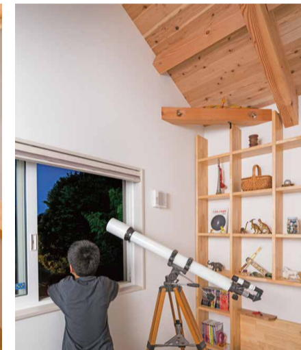
お兄ちゃんのスペースの壁面に付けられたおしゃれな整理棚は、なんとご主人の手づくりです。