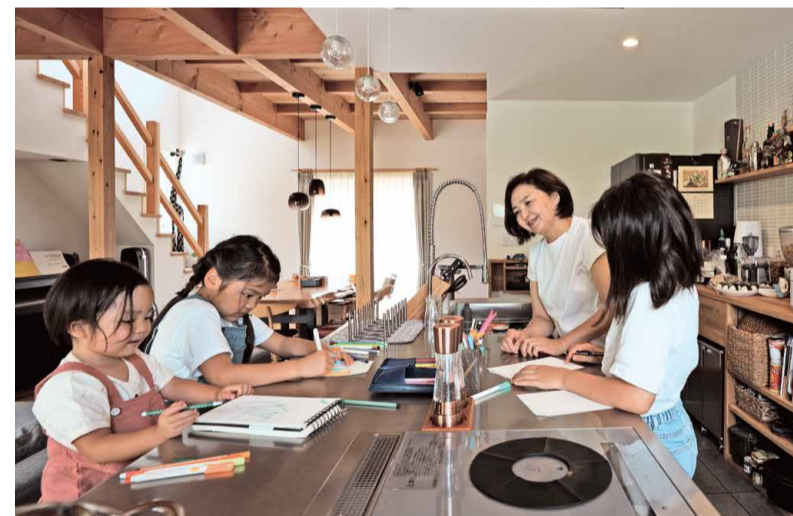
火を使わないIHクッキングヒーターは、お子様と一緒に調理しても安心。天板がフラットなので使っていない時はお絵描きや勉強の場所になっています。

ご新居で「真っ先に空気の違いを肌で感じました」という奥様。「洗濯物が部屋干しですぐ乾くなんて、感激しました」と笑います。また、キッチンにいても子どもたちの気配を感じながら作業に集中できるなど、家事全般の効率が良くなったと喜んでいらっしゃいます。「無垢材の床や天井の木の梁を見ているだけでテンションが上がるとおっしゃるのをご主人。以前はお子様と過ごす時間を大切にしようと、休日はキャンプなどにもよく出かけたそうですが、「今はウッドデッキで焚火をしたり、家族みんなでご飯をつくったり何でもできるので、家にいる時間が一番の幸せです」と普段の暮らしを心から楽しんでいらっしゃいます。