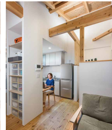
収納スペースを工夫し、使いやすく居心地がよいお母様の居室。小屋裏まで抜けた空間がゆとりを感じさせます。