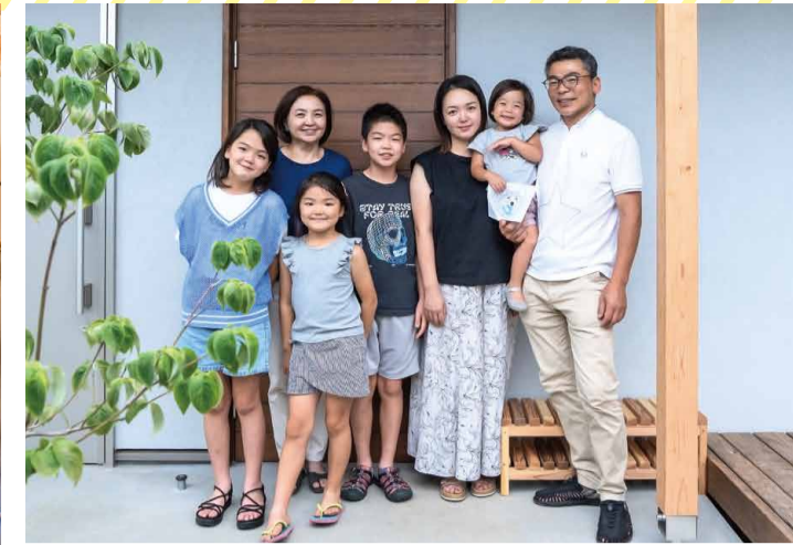
S様ご家族とお母様（左から2人目）。お子様はお兄ちゃんが11歳、女の子3人は10歳、8歳、3歳と遊びたい盛りで、毎日賑やかに暮らしています。