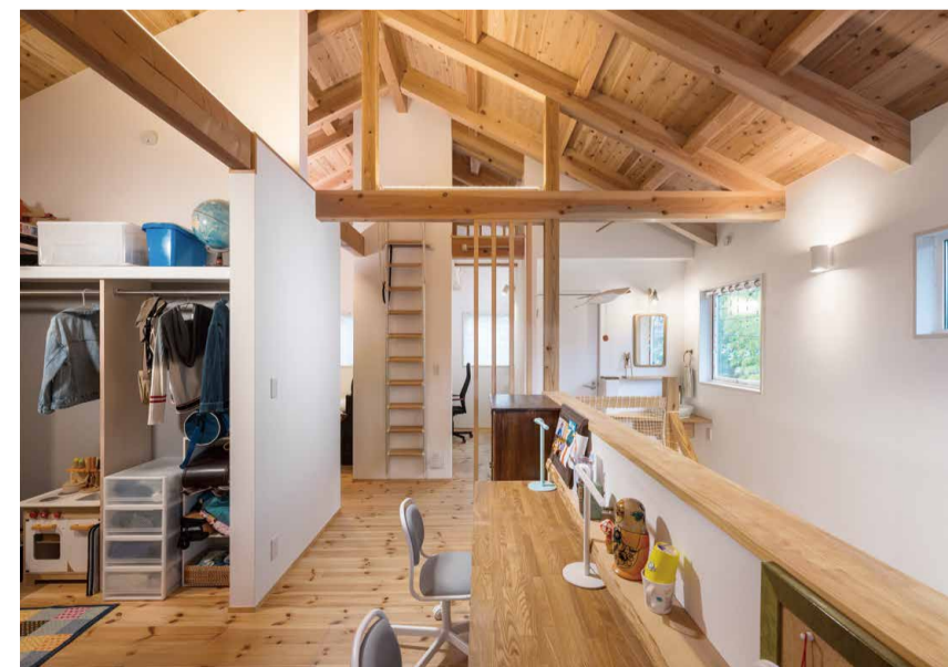
2階も大空間を壁やご主人手製の本棚等で仕切り、ご家族それぞれのスペースを確保しています。手前が女の子3人、正面突き当たりがお兄ちゃん、左がご夫婦の寝室。ドアがあるのは右手奥のトイレだけ。

分譲マンションで暮らしながらも「4人の子どもの成長と妻の母との同居を考慮して」住み替えを決断されたS様。1階、2階とも個室がなく、大空間を緩やかに仕切ることで将来に備えています。4人のお子様は仲が良く、一番下の遊び相手になったり、お母さんの料理を手伝ったり、宿題をしたりと、元気一杯に過ごしています。「おいしい生活の違いがあるので玄関は別がいいと思っていた」というお母様も、実際にはみんなと一緒にいる時間の方が多そう。「孫と一緒にいるのは楽しいし、娘の子育てを手助けするのも嬉しい」とおっしゃいます。「いつまでも家族のみんなの拠り所となる家にしたかったんです。成長に伴って手を加えていくものですから、ナルシマさんにはこれからもお世話になります」とご主人が笑顔でおっしゃってくださいました。