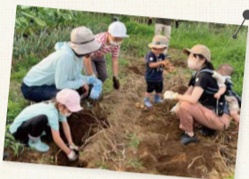
子どもたちも初体験のおいもより虫の方が気になる?