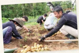
収穫量トップはもちろん、農業部長獲辺!(手前右)

6月某日、結成3年目のナルシマ農業部と有志一同でじゃがいも掘り大会を開催!土に触れる機会が減多にないスタッフも、童心にかえて夢中で掘っていました。畑の土が良いのか、大きくて良質なじゃがいもがアツという間に山盛りに。もうランチはこれで決まり!掘りたてのじゃがいもを丸ごと蒸かし、塩をかけて食べるじゃがバターならぬ「塩じゃが」と、みんな大好き「ポテトサラダ」。おまけに採ったピーマン、ミニトマト、ナスは専務手づくりのキッシュとなって、新鮮野菜尽してお腹いっぱいになりました。夕方には大敬副社長親子とひなかあさん親子も合流。食を通して笑顔が弾む、ナルシマらしい賑やかな一日でした。(あいざわ)