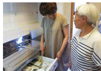
引き出しの中は必要な器具のみ。

少しコンパクトなものに入れ替えたから、一層使いやすくなったわ。最近電子レンジを最大限活用するレシピに凝っているの。準備も簡単