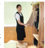
完成したロッカールーム。

先月号でもちょっとお伝えしましたが、某企業様の依頼によるオフィスや女子バスケット選手のロッカールームなど、改装作業が着々と進行中。採木棟梁手づくりの書類棚も好評で、社員の方から「良くなったね」と言われるとやはり嬉しいものです。仕事の内容に合わせた工夫も必要で、担当の方と一緒にアイデアを出し合いながら進めるのはとても勉強になります。完成したらまた改めてご紹介させていただきますね。