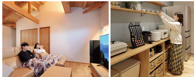
AV機器は2階のホールに設置。現わしの高い天井は、ご主人がナルシマに決めた理由の一つ。