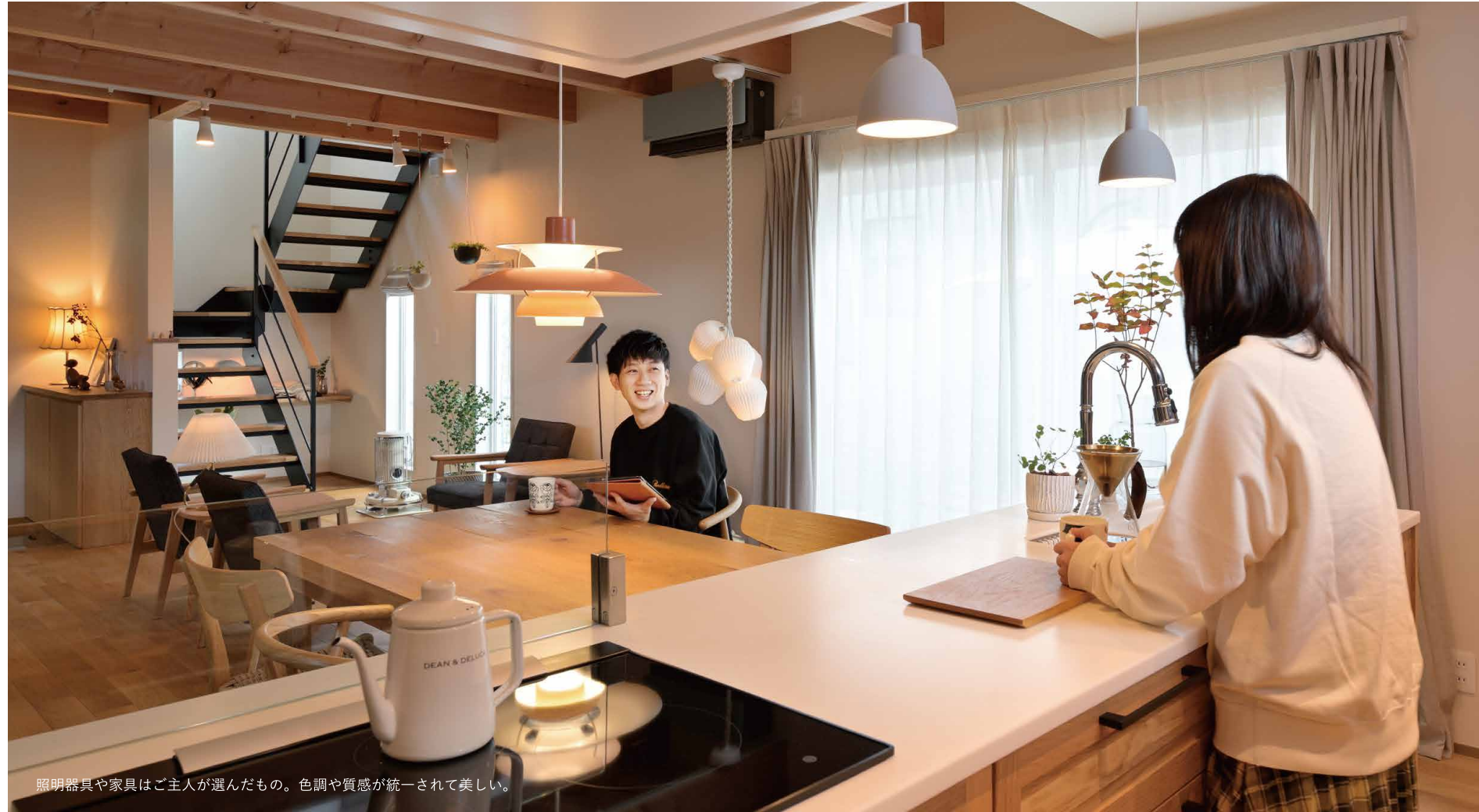
照明器具や家具はご主人が選んだもの。色調や質感が統一されて美しい。