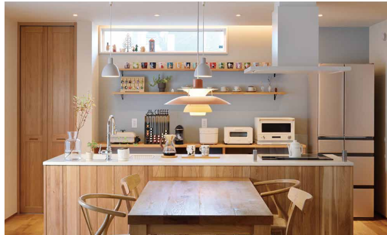
苦労して探した木調のアイランドキッチン。ダイニングテーブルは大阪からの取り寄せ。

家づくりを主に進めたのはご主人ですが「好みはほぼ同じなのでまったく問題ありませんでした」と奥様。まさに阿吽の呼吸です。「真夏の猛暑の時期は仕事から帰って、お気に入りのリビングの椅子に座るだけでほっとしました」と笑います。お二人そろってムーミンが大好きで、休日はムーミンパレーパークに出かけたり、ネットショップで入手したグッズを飾ったりと、日々の暮らしを楽しまれているとのこと。奥様は乗らずともご主人のバイク好きには共感しており、「二人とも好きなものに囲まれて暮らしている今が、本当に幸せ」と、ご新居での生活を心から楽しんでいるらっしゃるご様子でした。