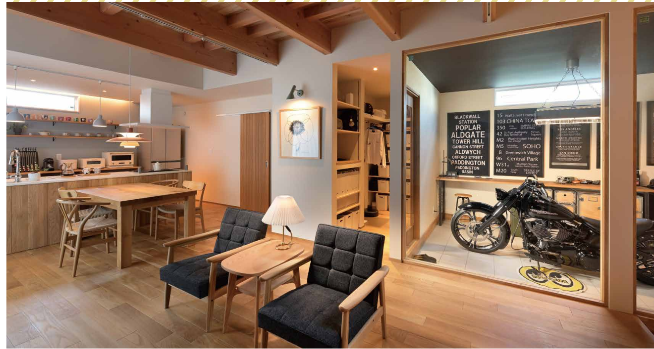
室内側の壁をガラスにしたガレージは、むしろギャラリーと呼びたくなります。ハーレーは入手後にブラックに塗り直したもので、手前のカリモク60のKチェアはウイスキーの樽を再利用した限定品。