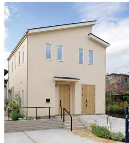
窓の配置にもこだわったシンプルな外観。右の扉がバイク用です。

家づくりを主に進めたのはご主人ですが「好みはほぼ同じなのでまったく問題ありませんでした」と奥様。まさに阿吽の呼吸です。「真夏の猛暑の時期は仕事から帰って、お気に入りのリビングの椅子に座るだけでほっとしました」と笑います。お二人そろってムーミンが大好きで、休日はムーミンパレーパークに出かけたり、ネットショップで入手したグッズを飾ったりと、日々の暮らしを楽しまれているとのこと。奥様は乗らずともご主人のバイク好きには共感しており、「二人とも好きなものに囲まれて暮らしている今が、本当に幸せ」と、ご新居での生活を心から楽しんでいるらっしゃるご様子でした。