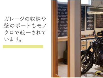
ガレージの収納や壁のボードもモノクロで統一されています。