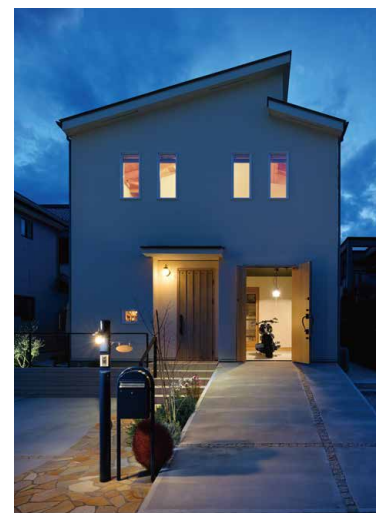
夕暮れ時になるとガレージの明かりが一層映えます。バイク好きにはたまらない風景。