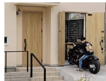
扉の前のスロープの距離もご主人が計算して決めたそう。