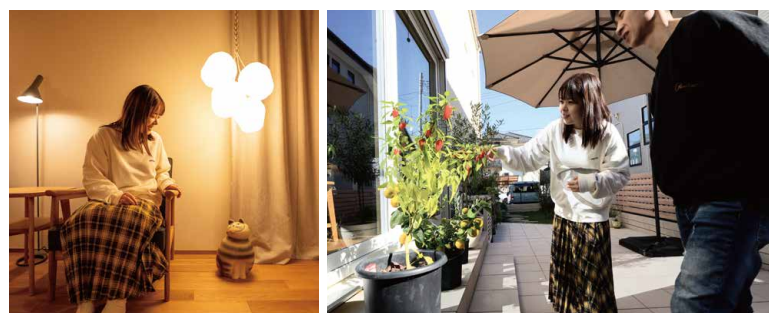
奥様が一番好きな場所。リサ・ラーソンの猫も犬のお気に入り。