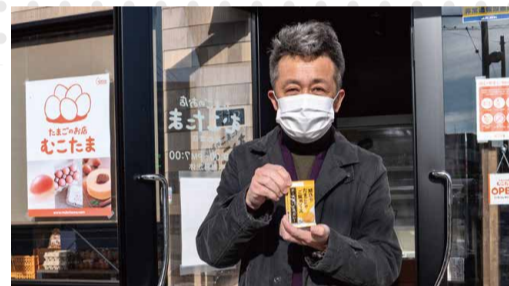
「むこたま」でたまごかけご飯用ソースを購入。

実際に目で見て、肌で感じる素敵な時間。これからの仕事にも大いに生かせる有意義なナル散歩でした。