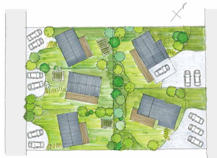
エントラック水海道/区画・植栽イメージ 両面に道路に挟まれた区画を5つに区分。各区画とも広々とした庭のスペースを確保し、敷地境界にはふんだんに植栽を配します。(イラストはイメージ)

美しい庭に癒されるのは、草木の緑が心を和ませ、心地良い日陰や風の流れをつくってくれるから。観て楽しんだり、子どもと一緒に遊んだりできれば、日々の暮らしはもっと豊かになるでしょう。緑には、人と自然をゆるやかにつなぎ、人と人の心を結ぶ魅力があります。つくり手と住まい手が同じ視点を持つことで、人と自然がゆるやかにつながる、街の緑が生まれます。本プロジェクトがめざすのは、土地と庭と家づくりを一体として、緑に癒される自然体の暮らしをつくること。ナルシマと一緒に、庭から考える家づくりを始めませんか。