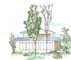
本プロジェクトのイメージビデオが完成、公開中です。ぜひご覧ください。