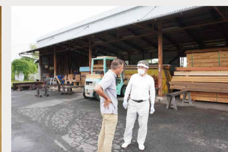
現場を進める前に、棟梁と打ち合わせ。