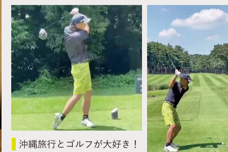
沖縄旅行とゴルフが大好き!