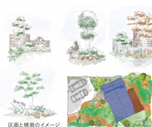
区画と植栽のイメージ

そんな実例も踏まえ、エントラック水海道では、私たちがさらに積極的にコミュニティづくりの後押しができるのではないかと考えています。区画全体の「木と緑と暮らす」というコンセプトはその重要なポイントの