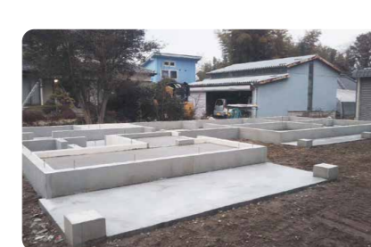
【基礎工事】 家本体を支える頑丈な基礎。底面までコンクリートで固める布基礎が標準です。