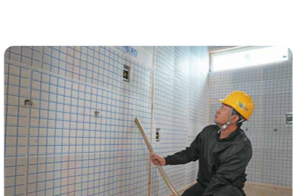
【壁断熱工事】 環境にやさしいセルロースを壁に吹き込むデコスドライ工法を採用しています。