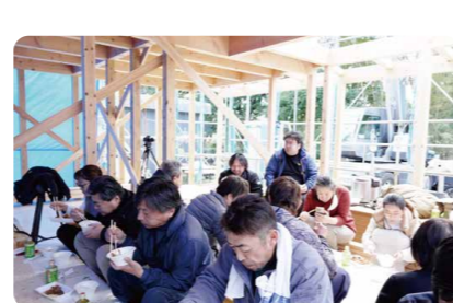
【ランチ上棟式】 お施主様ご家族と現場職人がランチをしながら顔合わせをし、工事の安全を祈願します。