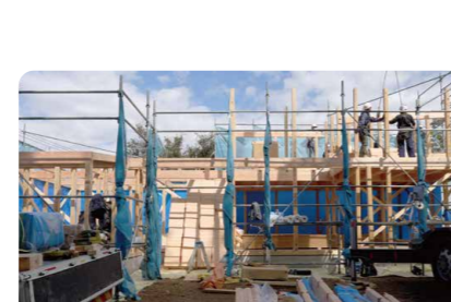
【上棟】 プレカットされた部材を手際よく安全に施工します。