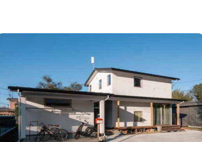
【完成】 完成後は定期点検を実施し、いつまでも快適にお住まいいただけるようサポートをしています。