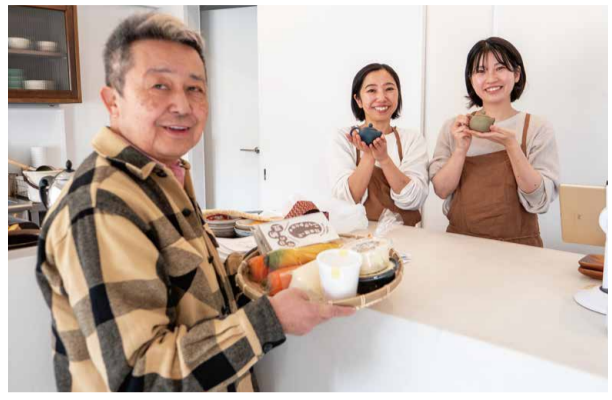
中央が奥様。おぼろ豆腐の美味しい食べ方を教えていただきました。