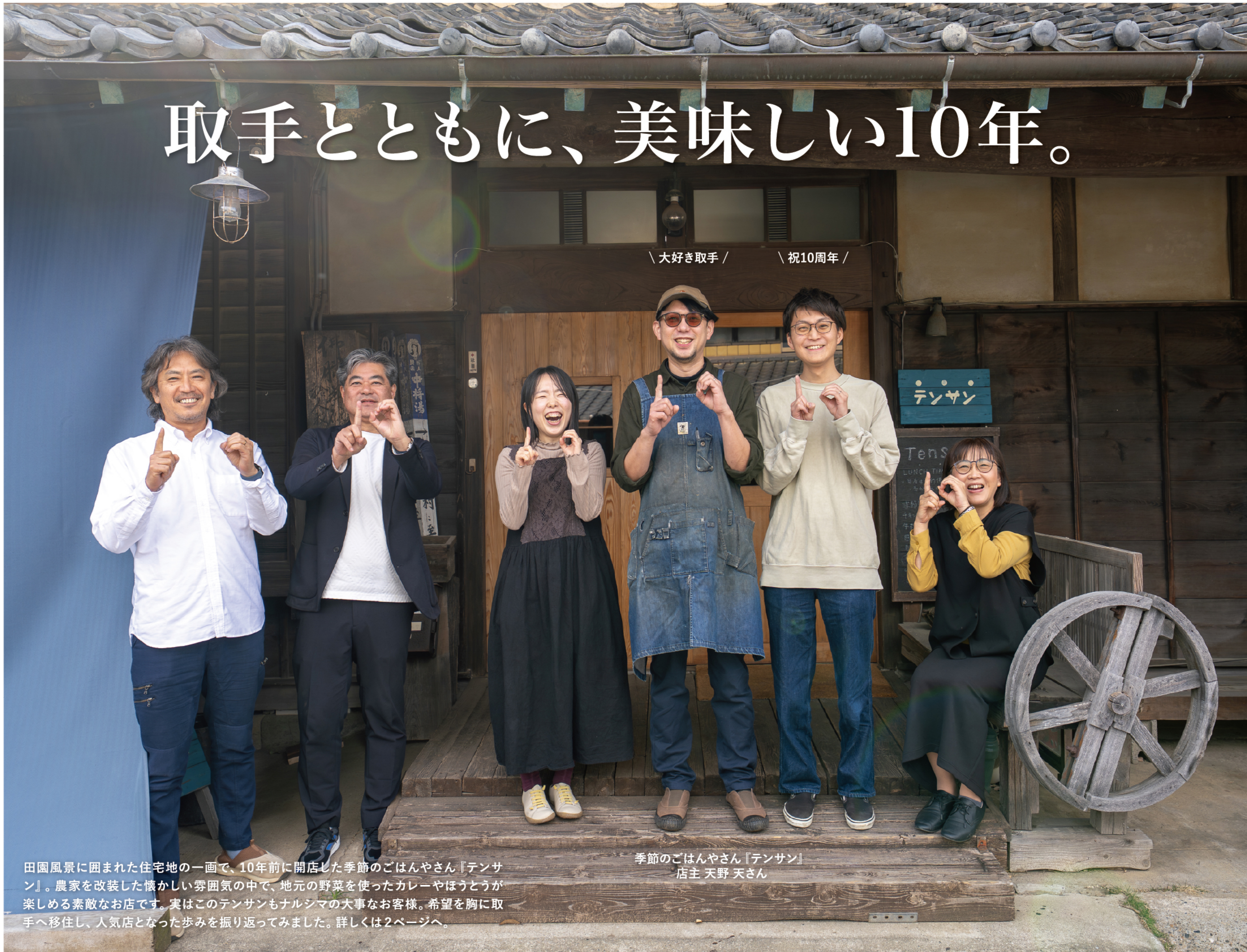
＼ 大好き取手 / 祝10周年 /