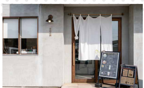
工房とカフェを併設したおしゃれなお店です。