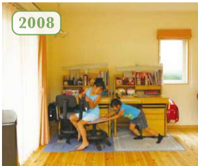
兄と妹の二人きょうだい。小学生の頃は勉強も食卓でやっていました。家族一緒に過ごす時間が長かったので、就職して独立した今もよく帰ってきますよ。(奥様) ※右の女の子は妹さんのお友だち