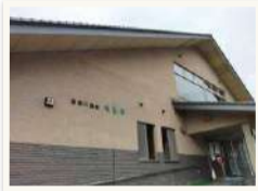
日本三大美肌の湯の一つ喜連川温泉の「もとゆ」地元の方と一緒にくつろぎました

いよいよ夏本番。この過酷な季節を乗り切らるために、心身ともに準備が必要なお年頃になってきたと感じています。と、いうわけで、6月某日、車で片道2時間半の弾丸日帰り温泉。行先は栃木県さくら市喜連川温泉「さくら市営もとゆ」。日本三大美肌の湯の一つということで、期待大!市営の温泉だけあって、地元の方に混ざって入るのは、ホテルや旅館とは違い、ちょっと地元民になった気がして嬉しくなりました。美人になるにはまだまだ数回は入らないと効果がわかるようにならないと思うので、今回は早朝から入って昼寝して、また入って、とゆっくり堪能したいと思います。(あいざわ)