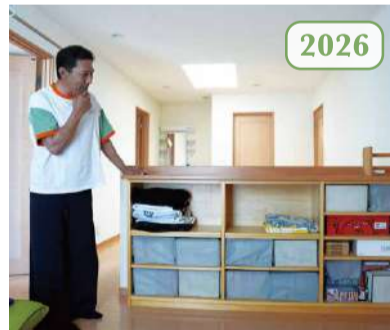
建築中の現場でキッチンカウンターの幅を変えて通路を広げてくれたり(左)、2階に予定外の棚を作ってくれたり(右)、棟梁の対応が嬉しかったですね。(ご主人)