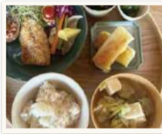
じゃがいもが大豊作!美味しくいただきました