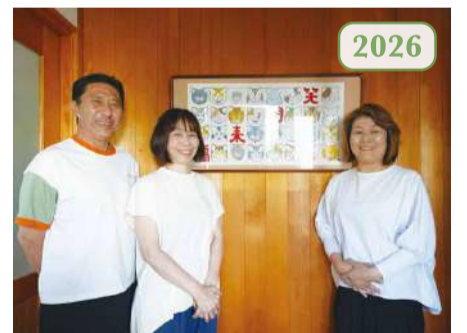
いつも明るく私たちを迎えてくださるS様。これからもよろしく願います!(成島)